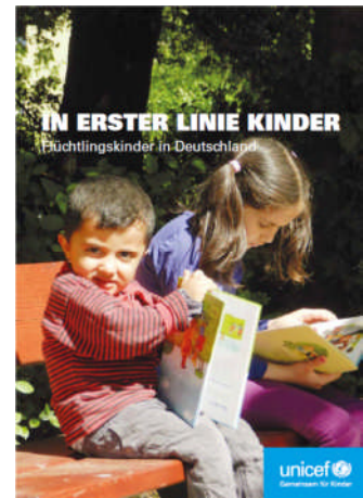
Zusammenfassung der Studie

Zu diesem Ergebnis kommt die neue Studie In erster Linie Kinder – Flüchtlingskinder in Deutschland , die vom Bundesfachverband Unbegleitete minderjährige Flüchtlinge e.V. (B-UMF) im Auftrag von UNICEF Deutschland erstellt wurde. Die Untersuchung beleuchtet umfassend die Situation der Kinder, die mit ihren Familien in Deutschland Zuflucht suchen.